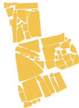
Der Vergleich der Kritiker zeigt, dass innerhalb des Stadtgebiets ähnlich viel Bauzone noch unüberbaut ist.